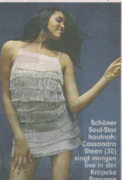
Schöner Soul-Star hautnah: Cassandra Steen (30) singt morgen live in der Kröpcke Passage

Ab 23 Uhr, bis Mitternacht 10 Euro/Abendkasse.